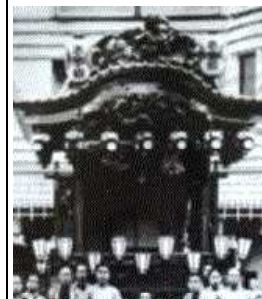
老丁目に書いある屋台が本石区に昭和13年