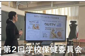
第2回学校保健委員会