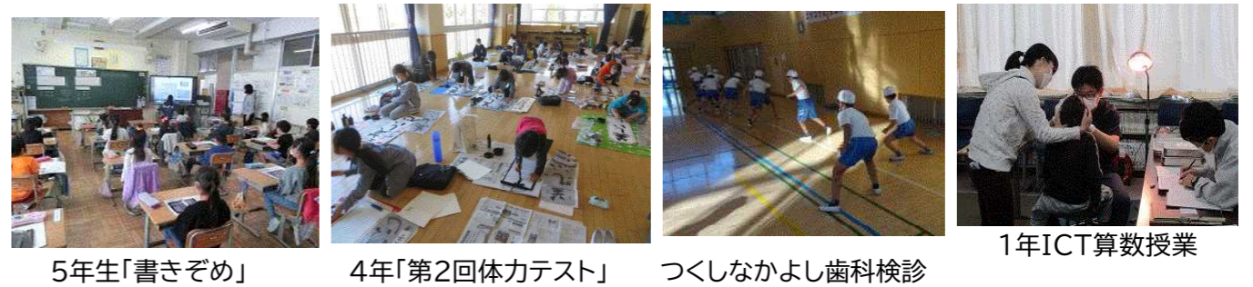
5年生「書きぞめ」 4年「第2回体力テスト」 つくしなかよし歯科検診 1年ICT算数授業

学校訪問 北部教育事務所・熊谷市教育委員会の先生方が石原小学校の教育活動を見に来る日です。